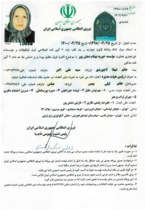
مجوز نیروی انتظامی