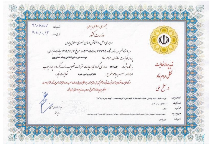
مجوز وزارت کشور