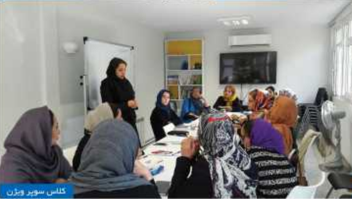
کلاس سبزی و میز