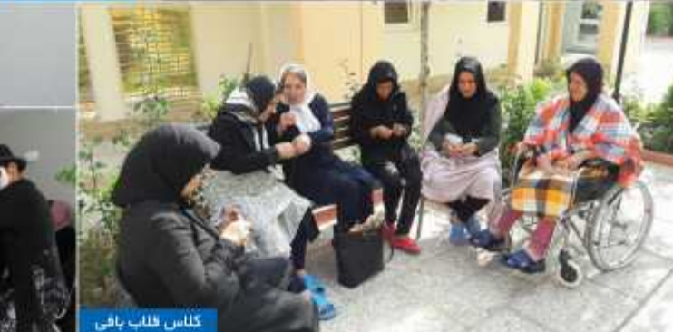
کلاس فلپ بافی