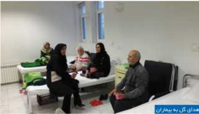
اهدای گل به بیماران