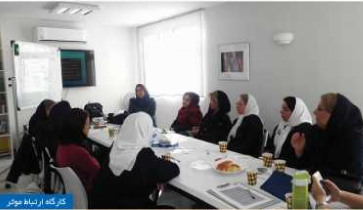
کارگاه ارتباط موثر